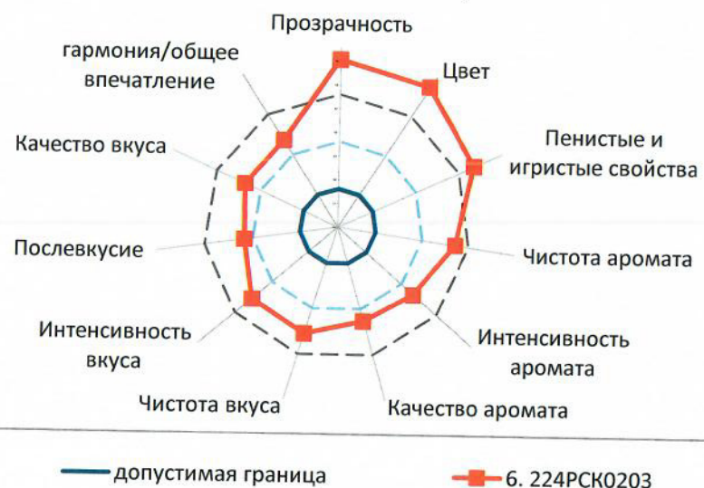
Рис. 1.2. Сравнение качества образцов вина игристого (дегустиация 13.09.2021 сет 2)

Протокол не может быть воспроизведен полностью или частично без письменного разрешения Руководителя Сенсорной лаборатории. Полученные результаты относятся к предоставленным Заказчиком образцам. Конец выписки из протокола.