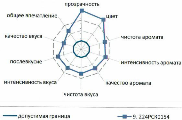
Рис.4.3. Сравнение качества образцов вина тихого (дегустиация 10.09.2021 сет 4)

Протокол не может быть воспроизведен полностью или частично без письменного разрешения Руководителя Сенсорной лаборатории. Полученные результаты относятся к предоставленным Заказчиком образцам. Конец выписки из протокола.