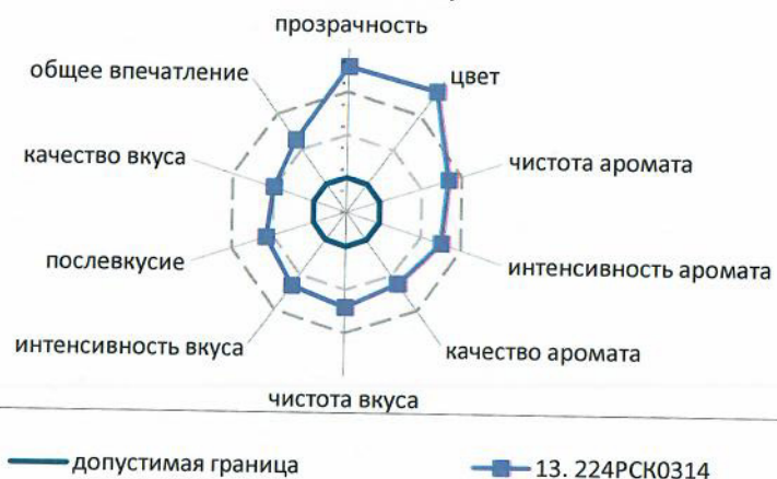
Рис.3.4. Сравнение качества образцов вина тихого (дегустация 16.09.2021 сет 3)

Протокол не может быть воспроизведен полностью или частично без письменного разрешения Руководителя Сенсорной лаборатории. Полученные результаты относятся к предоставленным Заказчиком образцам. Конец выписки из протокола.