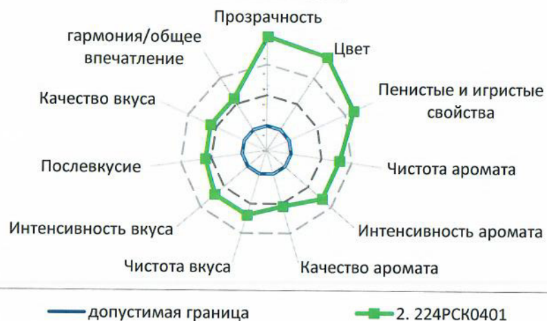
Рис.1.1. Сравнение качества образцов вина игристого (дегустиация 20.09.2021 сет 1)

Протокол не может быть воспроизведен полностью или частично без письменного разрешения Руководителя Сенсорной лаборатории. Полученные результаты относятся к предоставленным Заказчиком образцам. Конец выписки из протокола.