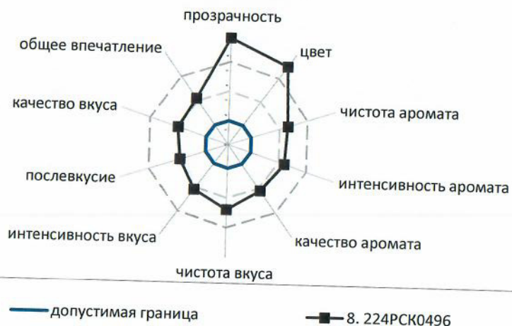
Рис.3.2. Сравнение качества образцов вина тихого (дегустация 22.09.2021 сет 3)

Протокол не может быть воспроизведен полностью или частично без письменного разрешения Руководителя Сенсорной лаборатории. Полученные результаты относятся к предоставленным Заказчиком образцам. Конец выписки из протокола.