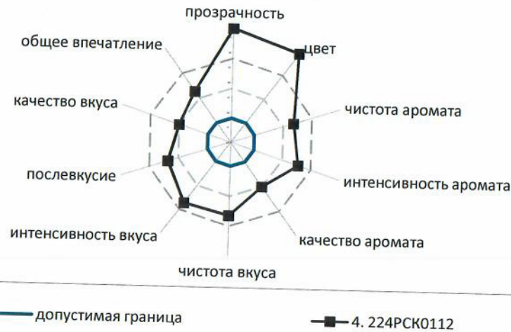
Рис.2.1. Сравнение качества образцов вина тихого (дегустация 09.09.2021 сет 2)

Протокол не может быть воспроизведен полностью или частично без письменного разрешения Руководителя Сенсорной лаборатории. Полученные результаты относятся к предоставленным Заказчиком образцам. Конец выписки из протокола