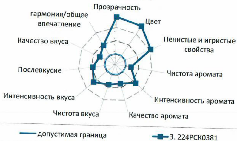
Рис.1.1. Сравнение качества образцов вина игристого (дегустация 17.09.2021 сет 1)

Протокол не может быть воспроизведен полностью или частично без письменного разрешения Руководителя Сенсорной лаборатории. Полученные результаты относятся к предоставленным Заказчиком образцам. Конец выписки из протокола.