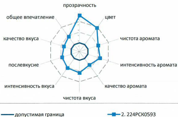
Рис.2.1. Сравнение качества образцов вина тихого (дегустация 24.09.2021 сет 2)

Протокол не может быть воспроизведен полностью или частично без письменного разрешения Руководителя Сенсорной лаборатории.