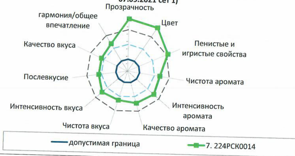
Рис. 1.2. Сравнение качества образцов вина игристого (дегустиация 07.09.2021 сет 1)

Протокол не может быть воспроизведен полностью или частично без письменного разрешения Руководителя Сенсорной лаборатории. Полученные результаты относятся к предоставленным Заказчиком образцам. Конец выписки из протокола