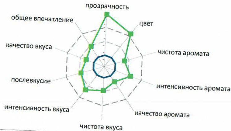
Рис.3.1. Сравнение качества образцов вина тихого (дегустиция 09.09.2021 сет 3)