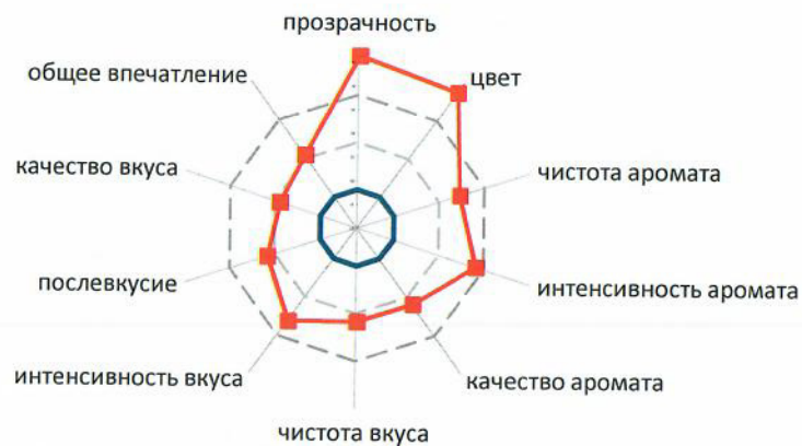
Рис.3.3. Сравнение качества образцов вина тихого (дегустация 07.09.2021 сет 3)