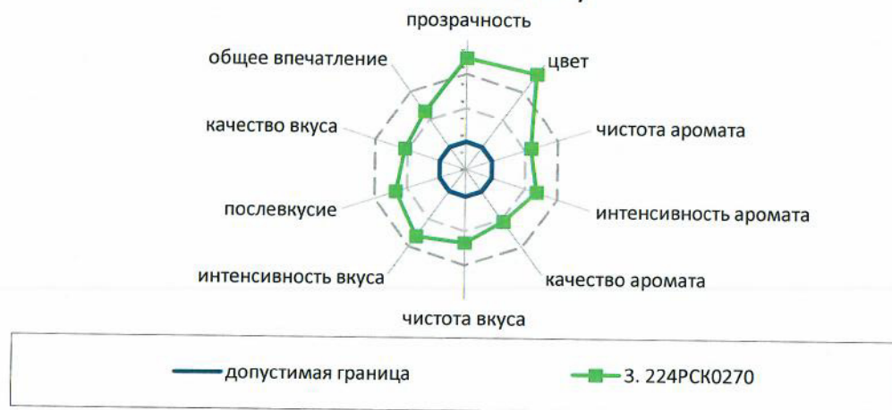
Рис.4.1. Сравнение качества образцов вина тихого (дегустиация 15.09.2021 сет 4)

Протокол не может быть воспроизведен полностью или частично без письменного разрешения Руководителя Сенсорной лаборатории. Полученные результаты относятся к предоставленным Заказчиком образцам. Конец выписки из протокола.