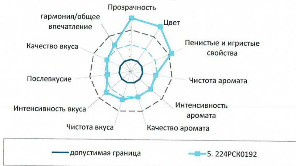
Рис. 1.2. Сравнение качества образцов вина игристого (дегустиация 13.09.2021 сет 1)

Протокол не может быть воспроизведен полностью или частично без письменного разрешения Руководителя Сенсорной лаборатории. Полученные результаты относятся к предоставленным Заказчиком образцам. Конец выписки из протокола.