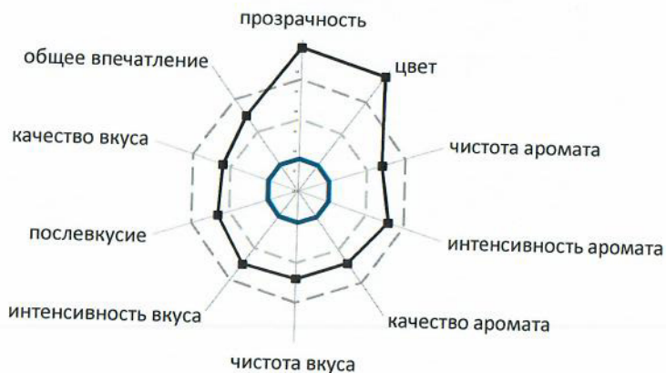
Рис.4.3. Сравнение качества образцов вина тихого (дегустиация 07.09.2021 сет 4)