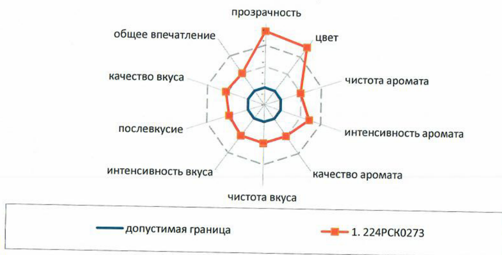
Рис.2.1. Сравнение качества образцов вина тихого (дегустиация 15.09.2021 сет 2)

Протокол не может быть воспроизведен полностью или частично без письменного разрешения Руководителя Сенсорной лаборатории. Полученные результаты относятся к предоставленным Заказчиком образцам. Конец выписки из протокола.