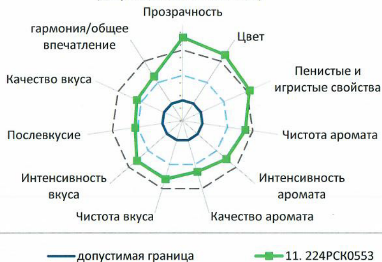
Рис. 1.3. Сравнение качества образцов вина игристого (дегустиция 24.09.2021 1сет)

Протокол не может быть воспроизведен полностью или частично без письменного разрешения Руководителя Сенсорной лаборатории.