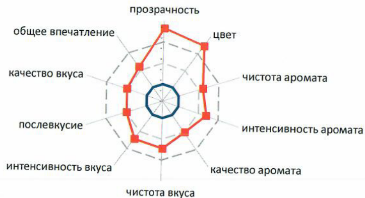
Рис.2.3. Сравнение качества образцов вина тихого (дегустиция 23.09.2021 сет 2)