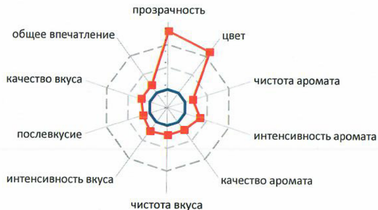
Рис.3.3. Сравнение качества образцов вина тихого (дегустация 21.09.2021 сет 3)