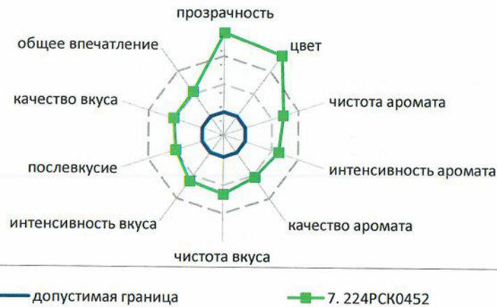
Рис.3.2. Сравнение качества образцов вина тихого (дегустиация 21.09.2021 сет 3)

Протокол не может быть воспроизведен полностью или частично без письменного разрешения Руководителя Сенсорной лаборатории.