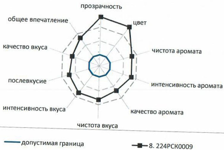
Рис.4.2. Сравнение качества образцов вина тихого (дегустация 07.09.2021 сет 4)

Протокол не может быть воспроизведен полностью или частично без письменного разрешения Руководителя Сенсорной лаборатории. Полученные результаты относятся к предоставленным Заказчиком образцам. Конец выписки из протокола