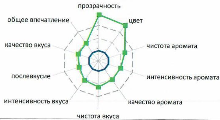
Рис.4.2. Сравнение качества образцов вина тихого (дегустация 21.09.2021 сет 4)