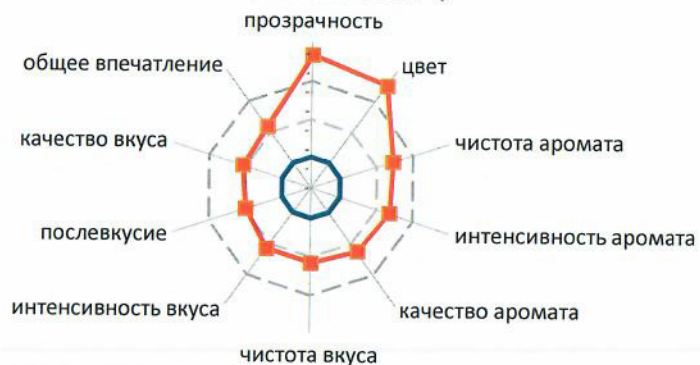
Рис.4.1. Сравнение качества образцов вина тихого (дегустиация 15.09.2021 сет 4)