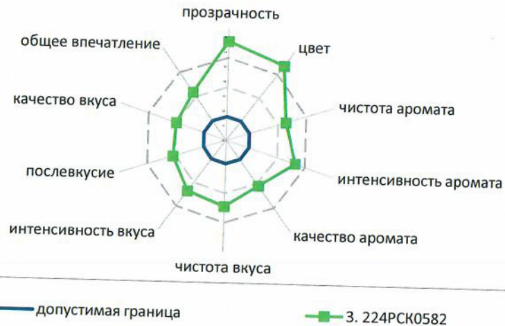
Рис.3.1. Сравнение качества образцов вина тихого (дегустация 24.09.2021 сет 3)

Протокол не может быть воспроизведен полностью или частично без письменного разрешения Руководителя Сенсорной лаборатории. Полученные результаты относятся к предоставленным Заказчиком образцам. Конец выписки из протокола.