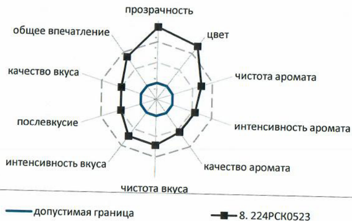
Рис.2.2. Сравнение качества образцов вина тихого (дегустиция 27.09.2021 сет 2)

Протокол не может быть воспроизведен полностью или частично без письменного разрешения Руководителя Сенсорной лаборатории. Полученные результаты относятся к предоставленным Заказчиком образцам. Конец выписки из протокола.