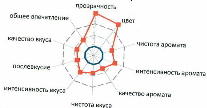
Рис.4.4. Сравнение качества образцов вина тихого (дегустация 09.09.2021 сет 4)