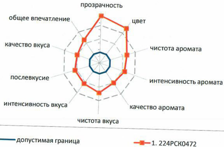
Рис.1.1. Сравнение качества образцов вина тихого (дегустация 27.09.2021 сет 1)

Протокол не может быть воспроизведен полностью или частично без письменного разрешения Руководителя Сенсорной лаборатории. Полученные результаты относятся к предоставленным Заказчиком образцам. Конец выписки из протокола.