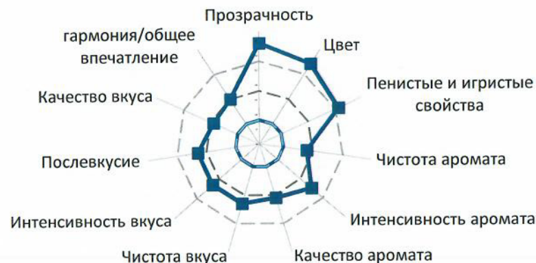
Рис.1.1. Сравнение качества образцов вина игристого (дегустиация 24.09.2021 сет 1)