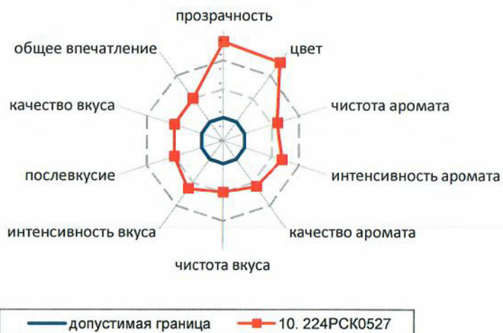
Рис.3.3. Сравнение качества образцов вина тихого (дегустиация 23.09.2021 сет 3)

Протокол не может быть воспроизведен полностью или частично без письменного разрешения Руководителя Сенсорной лаборатории.