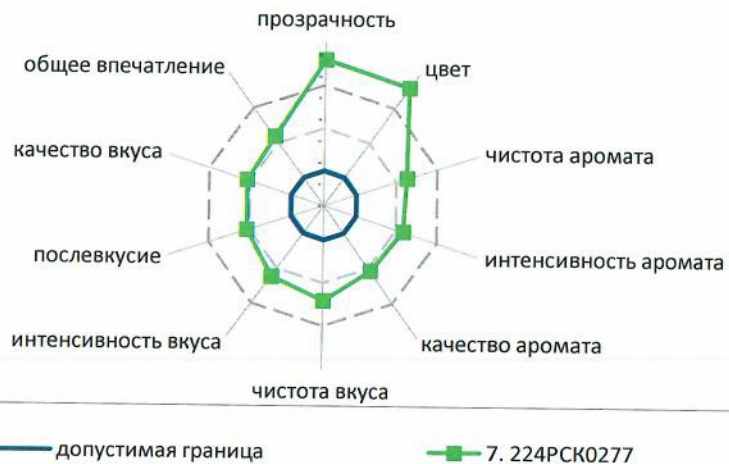
Рис.4.2. Сравнение качества образцов вина тихого (дегустиация 15.09.2021 сет 4)

Протокол не может быть воспроизведен полностью или частично без письменного разрешения Руководителя Сенсорной лаборатории.