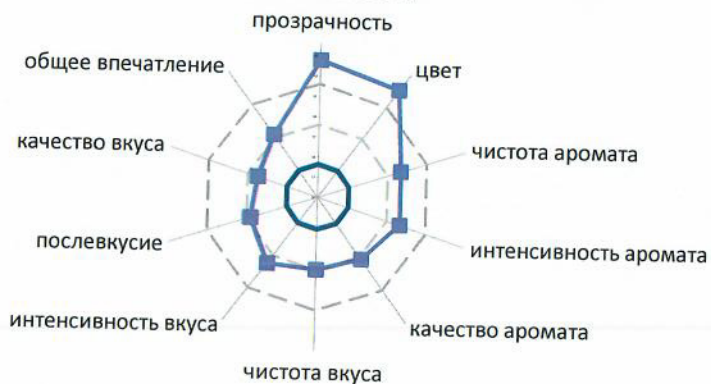
Рис.2.4. Сравнение качества образцов вина тихого (дегустация 15.09.2021 сет 2)